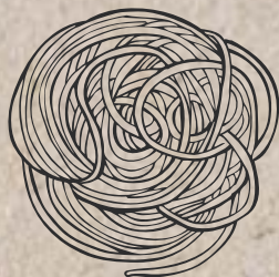
Spaghetti natur a, c