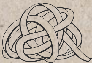
Tagliatelle a, c